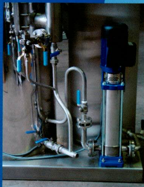
2 - particolare pompa in acciaio inox/stainless steel pump unit