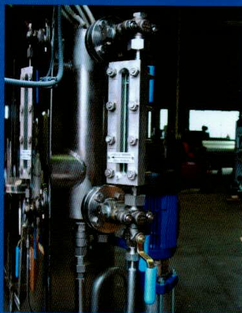
1 - particolare gruppo di livello in acciaio inox / stainless steel level unit